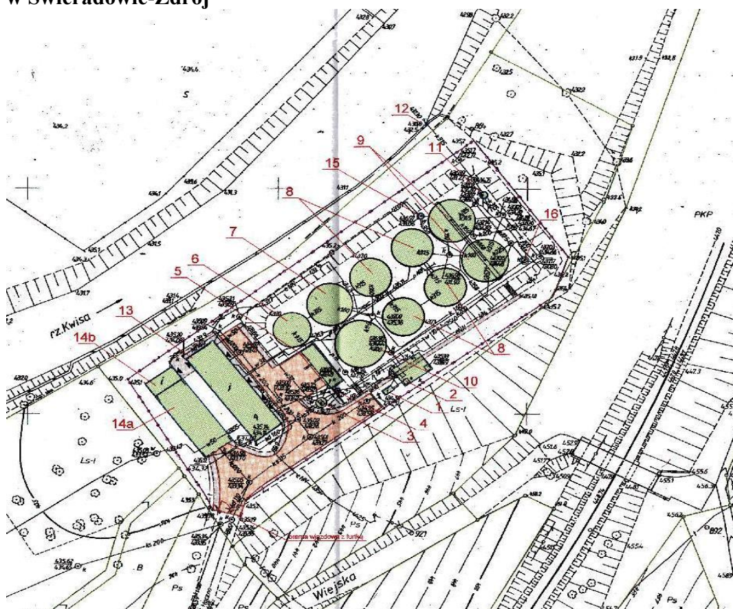
Rys. nr 1 Istniejący plan oczyszczalni ścieków przed planowaną przebudową i rozbudową w Świeradowie-Zdrój