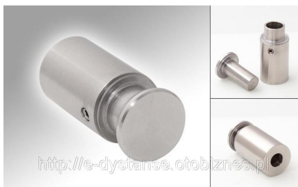
Fot. Dystanse do mocowania w ścianie.

płytach aluminiowych o grubości 9mm z wewnętrznym rdzeniem polietylenowym (3+6mm), minimalny okres gwarancji - 5 lat. Druk musi gwarantować estetyczny wygląd, wierność odwzorowania kolorów i fotograficzną jakość obrazu. Zarówno druk jak i materiał charakteryzują się wysoką odpornością na warunki zewnętrzne. Materiał łatwy w obróbce mechanicznej.