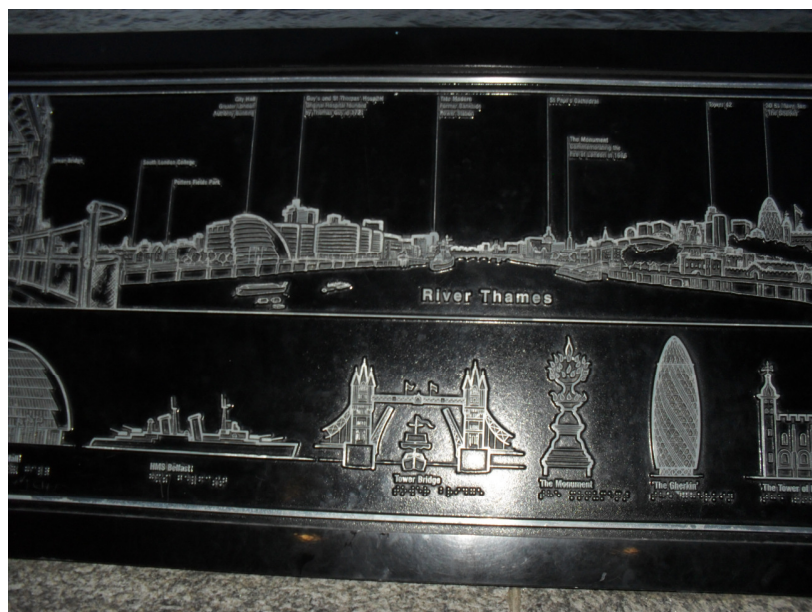
Fot. Przykładowe rozwiązanie Tablicy Informacyjnej (Londyn, Tower Bridge)

poręczy. Przymocowana tak aby osoby niepełnosprawne z ograniczoną funkcją wzroku mogły wygodnie wyczuć znaki tekstu w alfabecie Braille'a. Zakreślony Horyzont oraz szczyty i ważne obiekty będą wyczuwalne przez osobę niewidomą lub niedowidzącą a dodatkowy opis pozwoli na przeczytanie informacji w języku Braille'a. Tablice wykonane są z płyty mosiężnej o grubości 5mm frezowanej na całej powierzchni (poza widocznymi liniami) na głębokość 2mm ( 2+3=5\text{mm} grubość płyty). Ważne aby linie i punkty nie były wklęsłe lecz wypukłe tak aby były wyczuwalne przez osoby niepełnosprawne z ograniczoną funkcją wzroku.